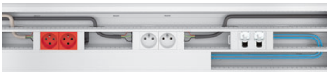
Tableau de choix (p. 794-795) Tableau de capacité, tableau de choix des dérivations (p. 803)